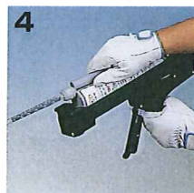
4 カートリッジをセットして下さい。