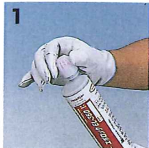
1 キャップをはずして下さい。