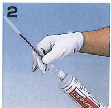
2 カートリッジにノズルをしっかり と締め込んで下さい。