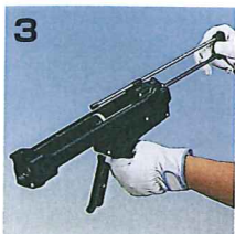
3 ガンのプランジャーを引き出し て下さい。